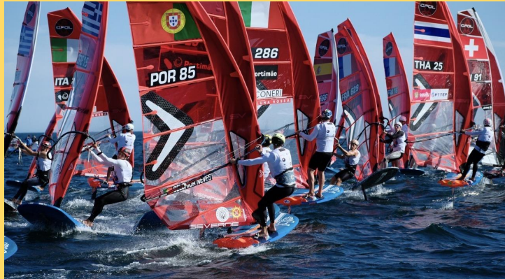
大混戦のスタート